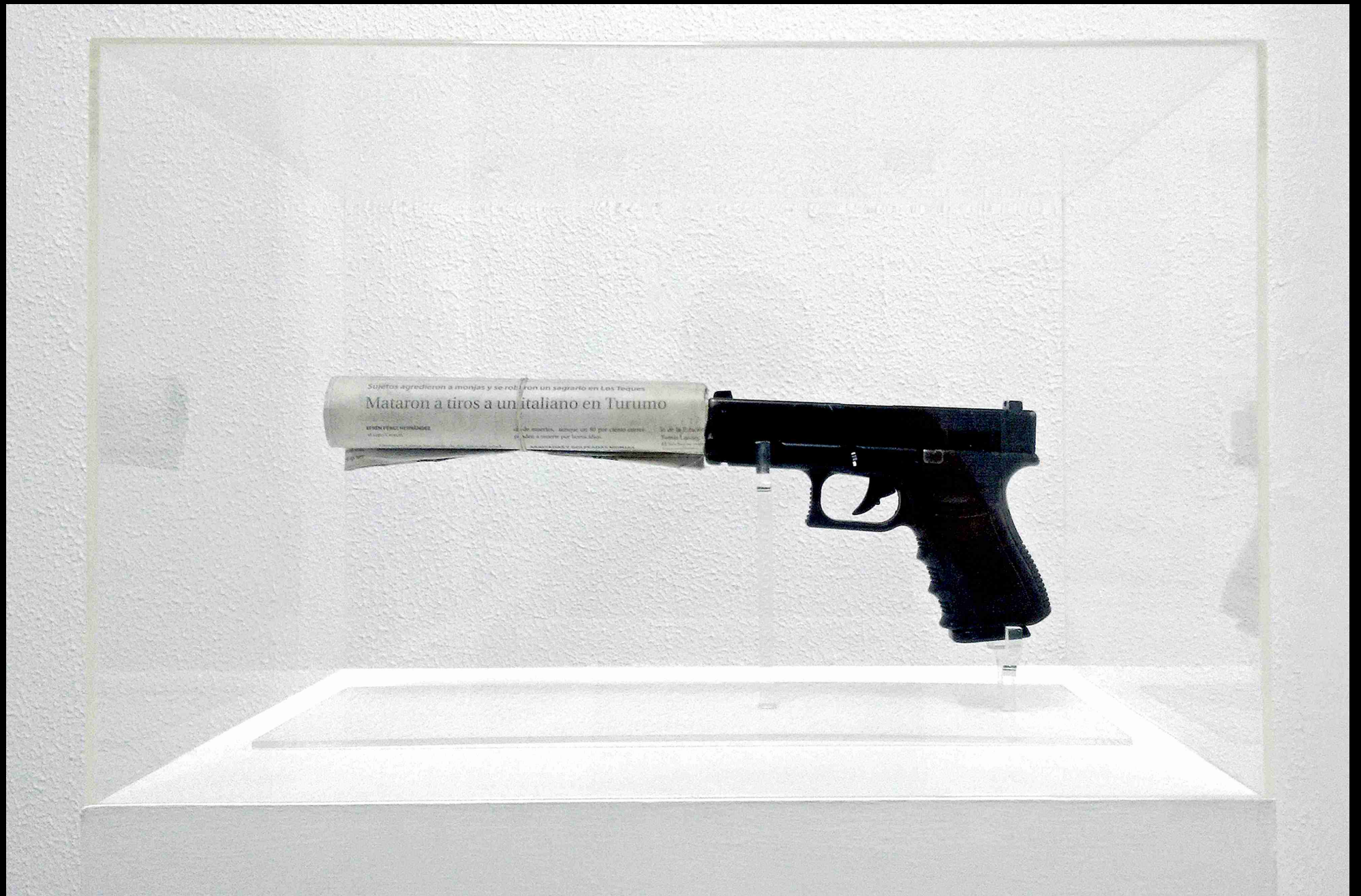
Vista general / General view : Group Exhibition "Editorial V: Papel", El Anexo / Arte Contemporaneo, Caracas, Venezuela. 2015